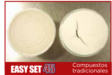
Grado de agrietamiento con espesores altos.